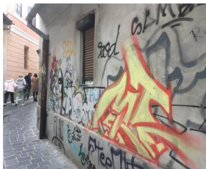
Str. Alecu Russo