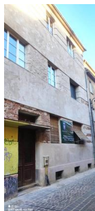
Sf Ioan 1