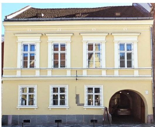
Gh Barițiu 7