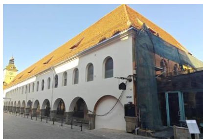
Piața Sfatului 14