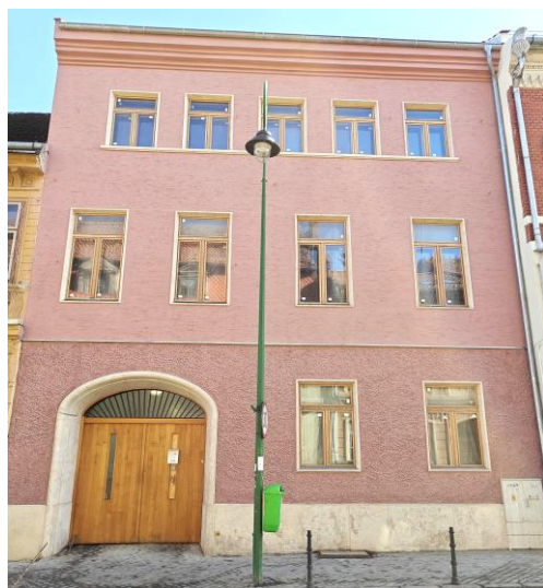
Poarta Schei 25