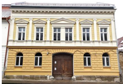
C Brîncoveanu 8