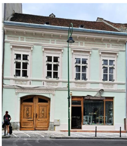
Gh. Barițiu 10