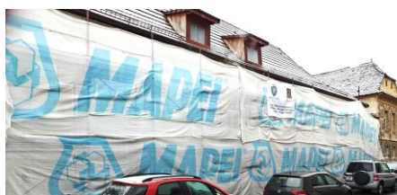
De Mijloc 26